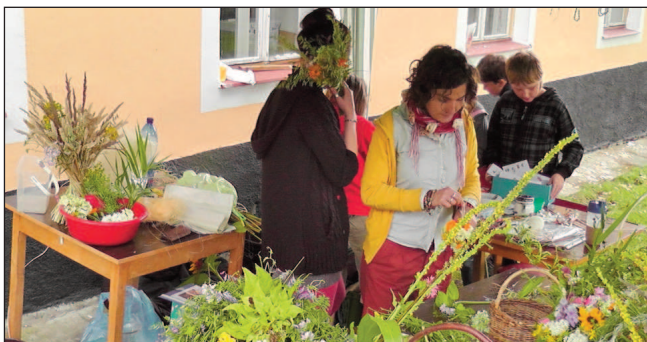
KOS připravil tradiční květinový stánek a tvořivou dílnu pro děti

Starosta Čkyně děkuje všem, kteří přispěli k dobré náladě a bezproblémovému průběhu letošní pouti. Restauratérům za bezvadné pohoštění, kvalitní a dobře vychlazené pivočko. (pp)