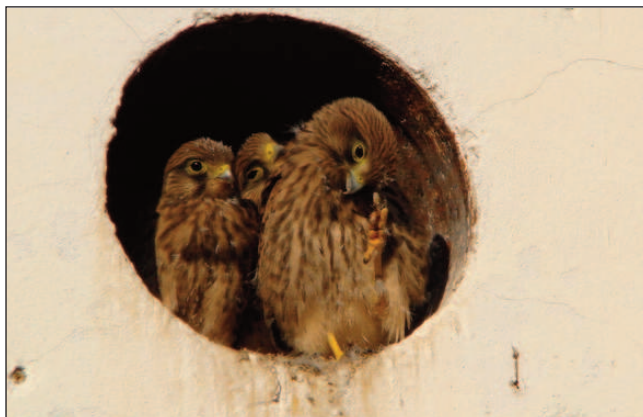
Mladé poštołky ve větráku