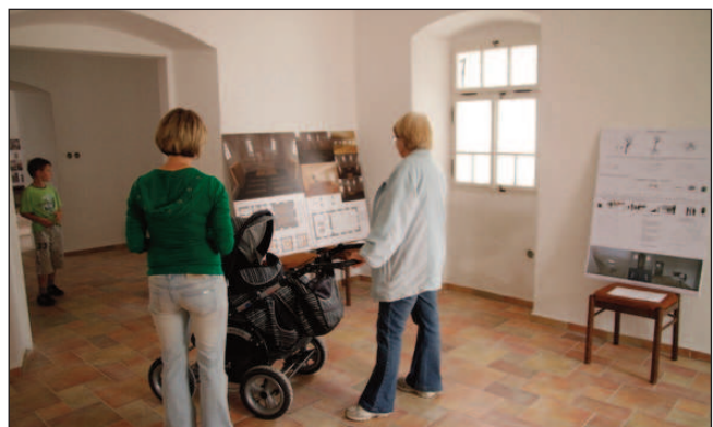
První návštěvníci rekonstruované synagogy