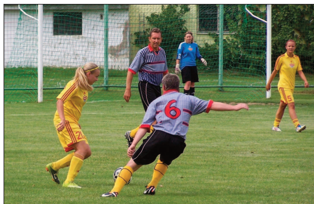
Zápas přinesl celou řadu pohledných akcí