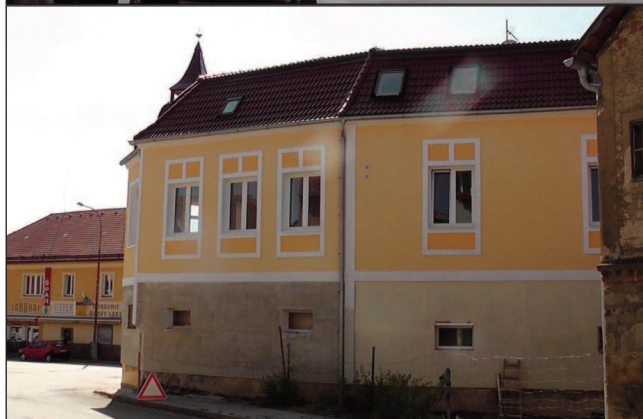
Opravovaný dům u náměstí